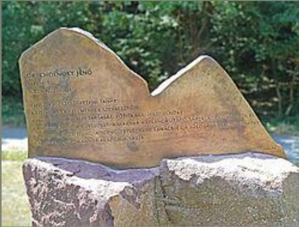
A Tamás- és Péter-hegy sziluettjét ábrázoló dombormű a füredi Cholnoky emléparkban elhelyezett hasábkövön