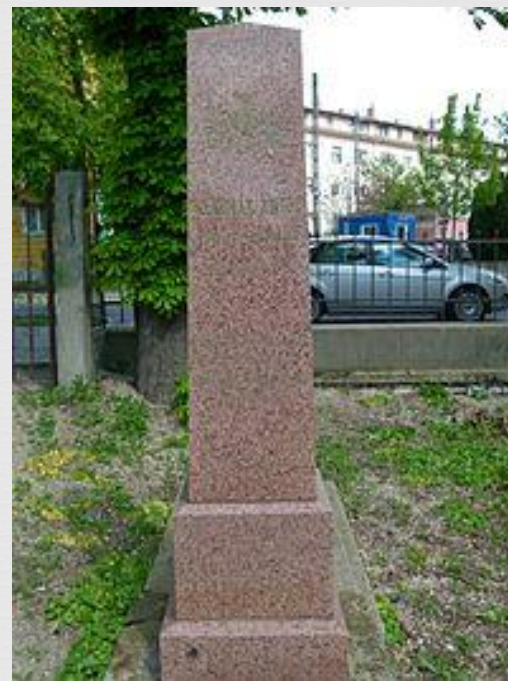
Csermák Antal sírja a veszprémi alsóvárosi temetőben