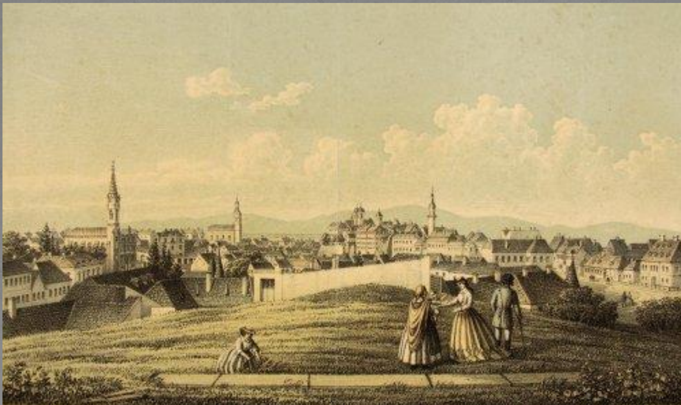
Slowikowsky Ádám: Veszprém régi látképe